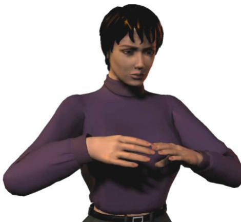
Optimale werkhogte voor knippen: tussen borst en schouderhoogte

De kapper verricht bij het werken aan de pompstoel de vaktechnische handelingen tussen borst en schouderhoogte met de schouders én ellebogen ontspannen laag hangend. Bij uitzondering mag de kapper hoger (tot ooghoogte) knippen.